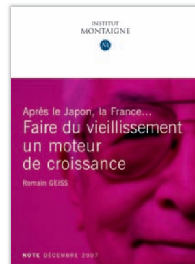
Après le Japon, la France... Faire du vieillissement un moteur de croissance par Romain Geiss