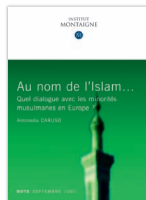
Au nom de l'Islam... Quel dialogue avec les minorités musulmanes en Europe ? par Antonella Caruso