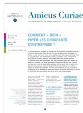
Comment « bien » payer les dirigeants d'entreprise ?