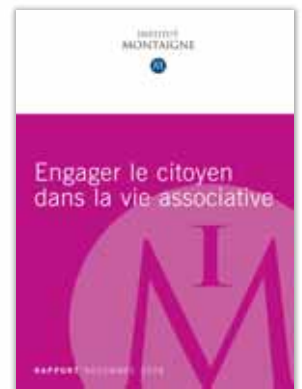
Engager le citoyen dans la vie associative