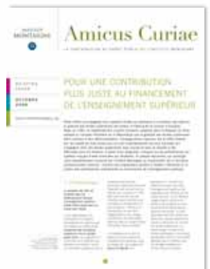
Pour une contribution plus juste au financement de l'enseignement supérieur