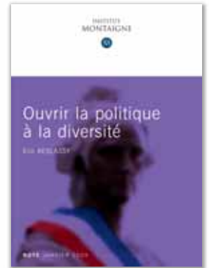
Ouvrir la politique à la diversité par Éric Keslasy