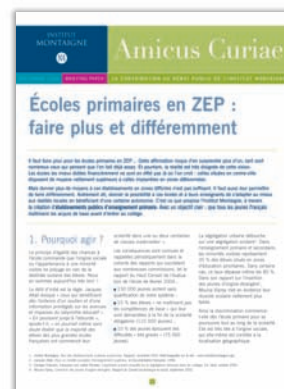
Écoles primaires en ZEP : faire plus et différemment