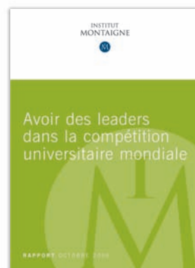
Avoir des leaders dans la compétition universitaire mondiale