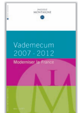
Vademecum 2007-2012 Moderniser la France