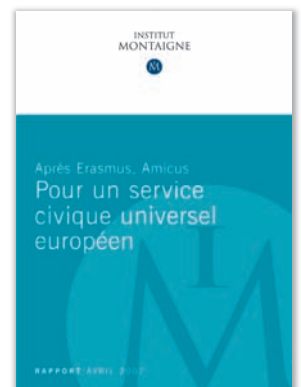
Après Erasmus, Amicus Pour un service civique universel européen