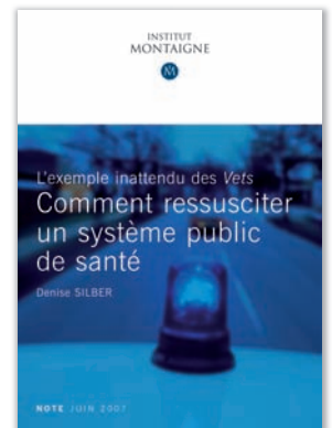
L'exemple inattendu des Vets : comment ressusciter un système public de santé par Denise Silber