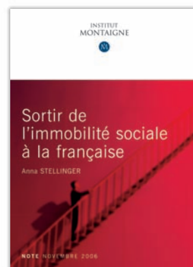
Sortir de l'immobilité sociale à la française par Anna Stellingner