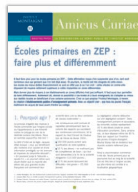
Écoles primaires en ZEP : faire plus et différemment